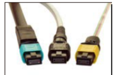
Lynx-Custpm Fit 熔接快接

此產品的生產過程符合 ISO 9001 認證 (JQA 證書編號: JQA-1135)