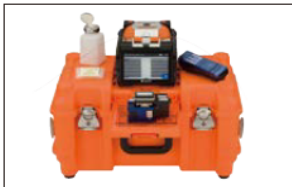
附工作台的收納箱