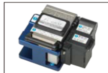
光纖切割刀 FC-6/ FC-6R 系列