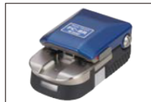
手持式光纖切割刀 FC-8R 系列